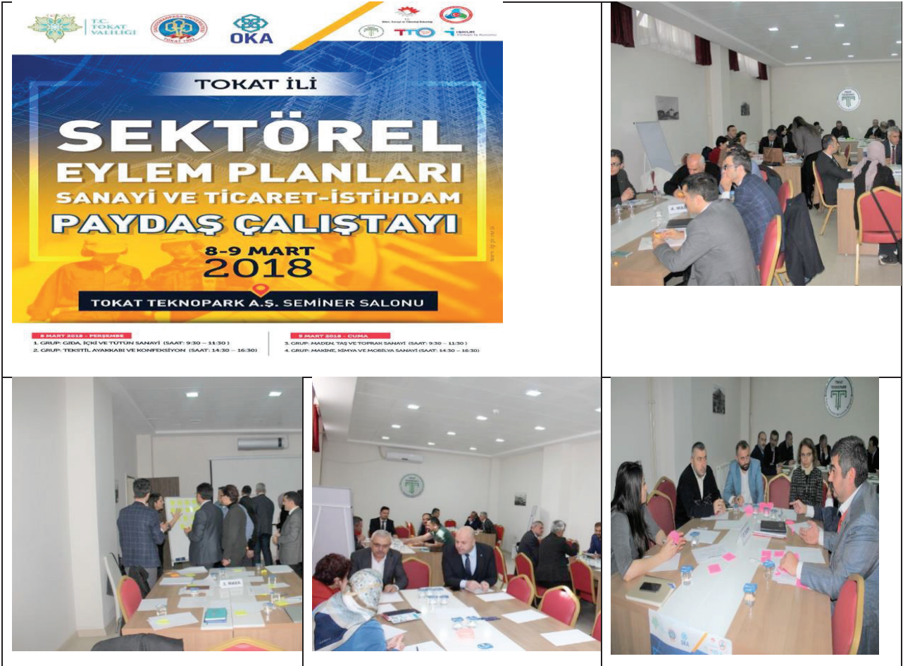
Şekil 2.Sektörel Eylem Planı Çalıştayı

şeklinde. İlk çalıştay 8-9 Mart 2018 tarihinde Gaziosmanpaşa Üniversitesi Teknoloji Transfer Ofisi koordinasyonunda Tokat Teknoparkta gerçekleştirilmiştir.